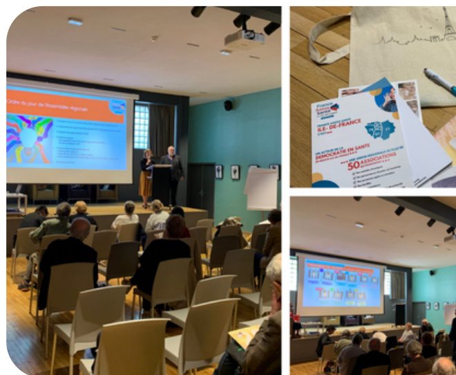
Assemblée Régionale du 13 mai 2022 à Paris